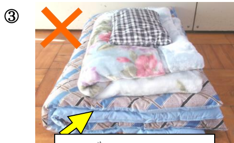
め め おり目が2つではない

※ うらめん 裏面の ただ 正しい お 置き方 かた を さんこう 参考にして、 かくにん みんなで確認しましょう！