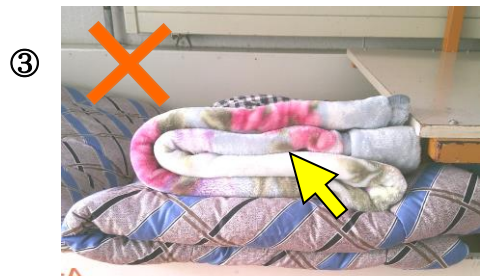
なが なが ほう ほう 長い方からたたんでいない