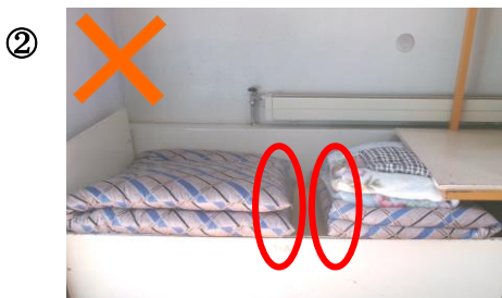
め め やま やま あ あ おり目の山がむかい合わせになっていない