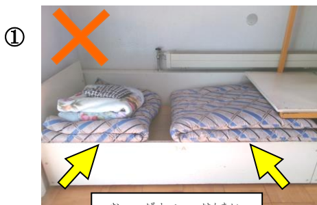
お ばしょ ばしょ はんたい はんたい 置く場所が反対